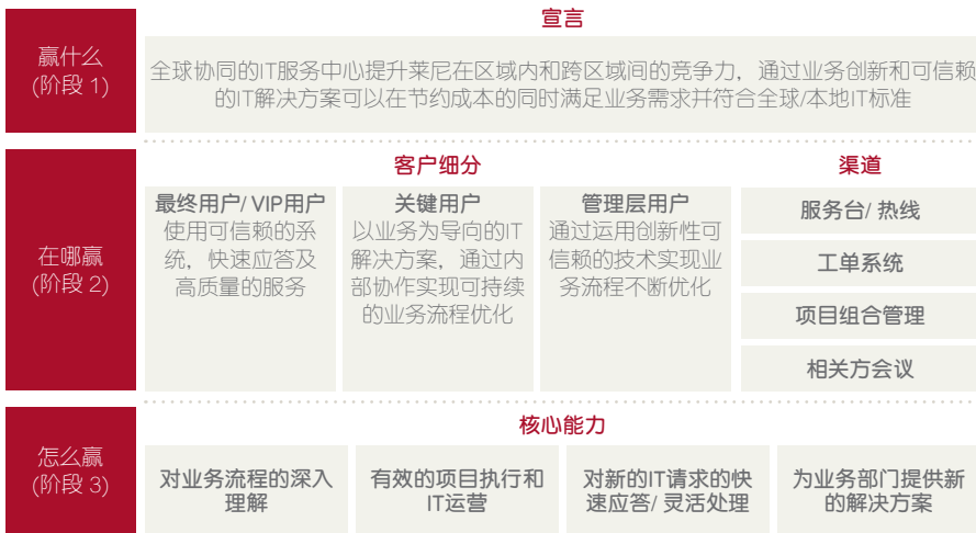
图2：莱尼全球IT服务中心发展战略蓝图（阶段1-3）

毕博通过运用其专业的咨询方法，对所提出的47个全球指导原则进行了进一步的提炼和讨论，并达成了共识。这些指导原则明确了IT服务中心的定位，以及与总部IT组织之间的合作模式。这些指导原则的明确有助于提升区域IT服务中心的能力，同时更好地实现其与全球IT组织之间的协作。